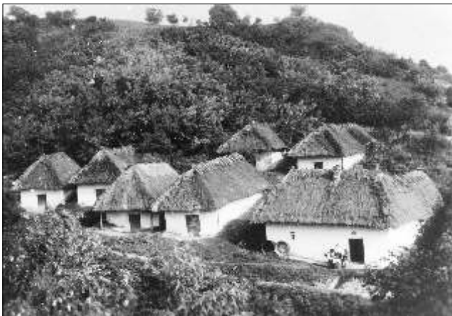
Túliace sa hajlochy – skrýše buriaceho vínneho moku.