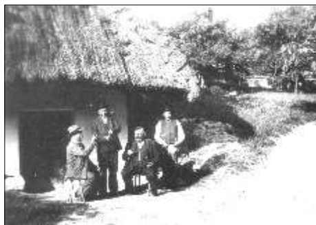
Prvá degustácia vína majiteľov viníc.

Dôležitá pre obyvateľov Hlohovca bola otázka samotného predaja vína. Podľa starého práva sa v Hlohovci mohlo predávať len tunajšie, miestnymi vinohradníkmi dorobené víno a to až do roku 1848, kedy bolo toto staré privilégium zrušené. Vinohradníci boli oprávnení predávať svoje víno na jarmokoch a inak pod vlastnou viechou. Keďže však väčšina Hlohovčanov boli okrem iného povolania aj vinohradníkmi, bolo potrebné rozdeliť vinohradníkov do skupín, ktoré si striedali oprávnenie mať výčap vína pod vlastnou viechou. Podľa toho, ktorá skupina bola práve na rade, jej členovia mohli bez obáv z potrestania čapať vlastné víno.