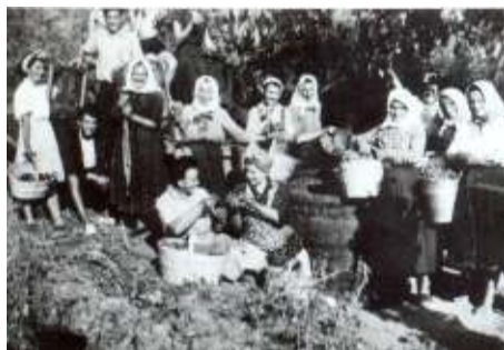
Skončí sa deň oberačky hrozna, ku ktorému patrí malá výslužka pre deti a vnukov.