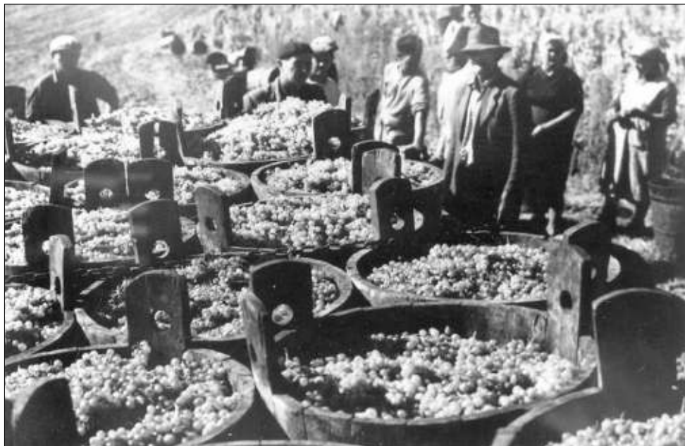
Naplnené kade kvalitným hroznom čakajú na ďalšie spracovanie.

Vo viniciach na Panónii sa pestovali hlavne druhy ako Veltlínske zelené a červené, Silván zelený a červený, Dievčie hrozno, Gamay biely, Rizling, Čabanská perla, Malingre, Muškát, Ottomel, Chrupka, Burgundské modré, Tramín, Ezerjo a Medovec. Posledne menovaná odroda bola opatrená špeciálnou ochrannou známkou firmy. Tiež všetky Burgundské vína boli chránené známkou VATRA hostinskými vínnymi pivnicami v Prahe.